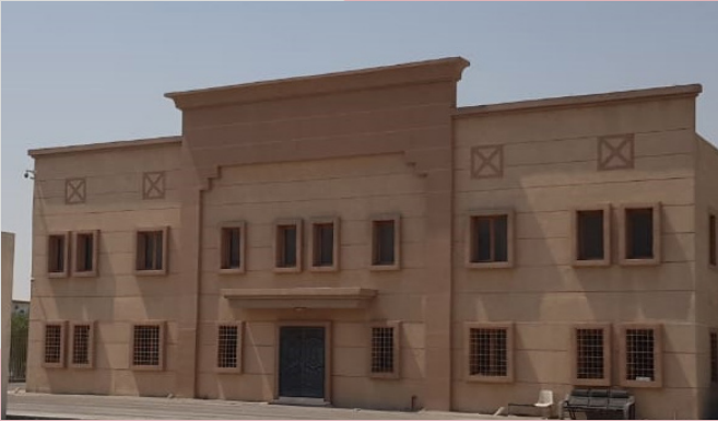
Dammam Factory مصنع الدمام

افتتح مصنع الاء الجزيرة سنة 2017 م في منطقة الصناعية الثانية الدمام، ويعتبر المصنع الفرع الثاني لمصانع شركة الاء الجزيرة حيث تم انشاء مصنع الأول في الكويت - منطقة صبحان الصناعية عام 1994 , وتم تجهيز المصنع بأحدث المعدات الصناعية ذات التقنية العالية حيث جرى اختيار أنواع المعدات المطلوبة وفقا لدراسة قام بها أحد البيوت الاستشارية المختصة بأعمال التصنيع , معظم المعدات الموجودة بالمصنع مجهزة بنظام سي ان سي . وهذا النظام يجعل الأجهزة والمعدات أكثر مرونة في عملية التصنيع كما يعطي مشغلي المعدات القدرة على التصميم حسب الاشكال المطلوبة من قبل مهندس التصميم.