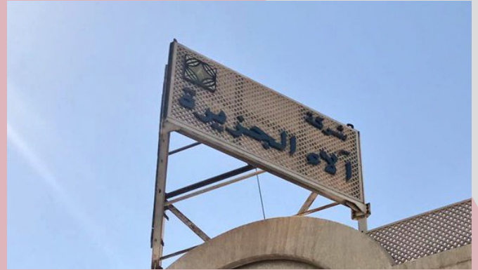
Kuwait Factory مصنع الكويت